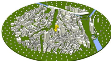
図1: 流体解析用3Dモデル