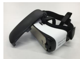
図2: Gear VR

(2) (1)の技術を用いて解決する都市・地域の課題のイメージ ※課題については、別紙3の(ア)～(シ)の課題分野への対応を記載ください